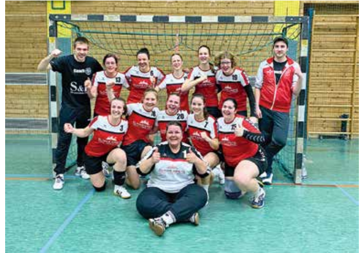
Die TSV-Handballerinnen feierten einen 33:22-Heimsieg gegen die HSG Dietmannsried/Altusried.

Erfolgsgeschichte an der Platte: Drei Jahre Tischtennis beim TSV Oberstaufen. Was vor genau drei Jahren als ambitioniertes Projekt startete, hat sich mittlerweile fest in der Sportlandschaft von Oberstaufen etabliert: Die Tischtennis-Abteilung des TSV Oberstaufen feiert ihr dreijähriges Bestehen und blickt