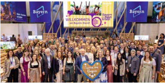
Feierliche Eröffnung des Bayern-Stands auf der ITB in Berlin.