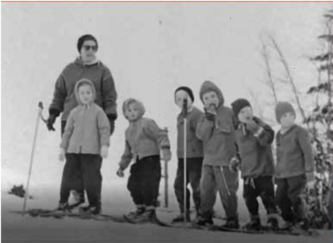
Christl Cranz, im Kreise ihrer Steibinger Skischüler aus BR-Retro-Mediathek, Abendläuten in Weiler im Allgäu, vom 13.02.1960.

Am Freitag, den 6. Februar 2026 beginnen die XXV. Olympische Winterspiele in Mailand und Cortina (Italien). Das erinnert uns an die IV. Winterspiele im Februar 1936, also vor 90 Jahren in Garmisch-Partenkirchen und an Christl Cranz, eine der berühmtesten Mitbürgerinnen unserer Gemeinde.