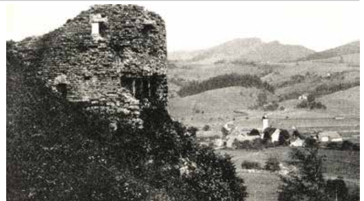
Ausstellung Ritterträume und Ruinen 2025 – Ringenberg bei Maierhöfen 1906.

Weitere Termine sind im Veranstaltungskalender der Gemeinde Stiefenhofen veröffentlicht. Wir freuen uns auf Ihren Besuch.