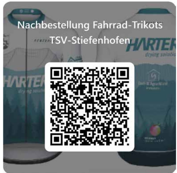
QR-Code für Nachbestellung Fahrrad-Trikots TSV-Stiefenhofen