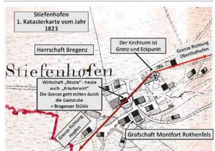
Stiefenhofen im Jahr 1823.