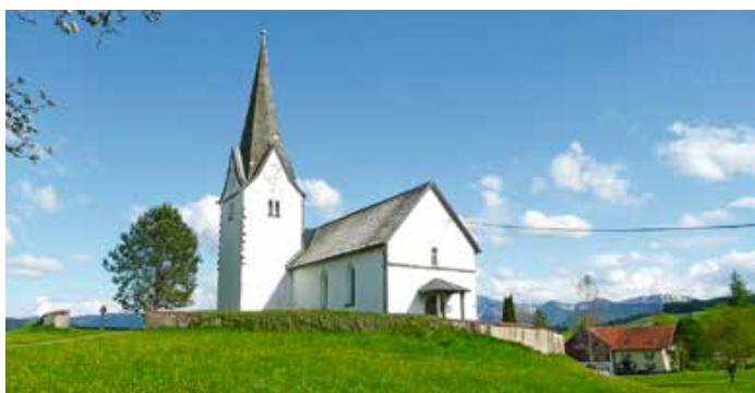
Kapelle St. Stephan in Genhofen.