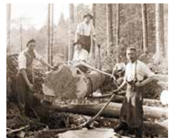
Holzarbeiter 1937 in Grünenbach.

Vortrag am Freitag, den 28. März, um 19.30 Uhr Manfred Fink, Archivar im Gemeindearchiv Oberstaufen hält einen spannenden Vortrag über die harte und gefährliche Arbeit der Holzarbeiter an den steilen Berghängen im Hochgratgebiet. Mit eindrucksvollen Bildern und einer Filmvorführung wird auch die Herausforderung des Holztransportes in die Sägewerke anschaulich dargestellt. Kommen Sie vorbei und erleben Sie eine faszinierende Reise in