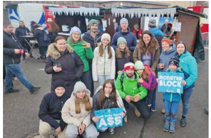
Die Volleyballer des TSV Oberstaufen waren bei der deutschen Snowvolleyball-Meisterschaft im Einsatz.

Damen: Die Damen waren zuletzt spielfrei. Zum Saisonendspurt gastieren sie diesen Samstag in Memmingen. Am darauffolgenden Samstag (22. März) absolvieren sie um 17.30 Uhr ihr letztes Heimspiel der Saison gegen die SG Biessenhofen-Marktoberdorf 2. Das Team freut sich noch einmal über lautstarke und zahlreiche Zuschauerunterstützung in der Turnhalle Kalzhofen. Ebenso freuen sich die Staufner Handballdamen jederzeit über neue Spielerinnen ab 16 Jahren, egal ob mit oder ohne Handballvorerfahrung. Trainingszeiten Montag und Mittwoch 19.30 Uhr bis 21.00 Uhr in der Turnhalle Kalzhofen.