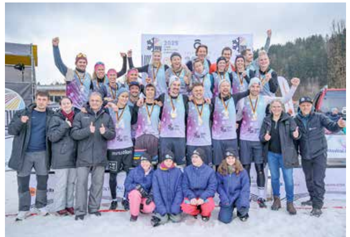
Ein Hoch auf die Gewinner:innen der sechsten Snow-Volleyball Championships!

Nach einer Tanzeinlage des Familienzentrums baten die Herren wieder zum „Tanz“ auf dem Center-Court. Die Favoriten bei den Männern drückten dem Turnier ihren Stempel auf und zogen souverän ins Endspiel ein, ebenso wie ihre an Position zwei gesetzten Kontrahenten. So kam es im Finale zu einem fast rein bayerischen Duell. Am Ende behielten Sebastian Burgis, Tim Noack,