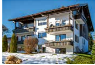
Mehrfamilienhaus in Oberstaufen