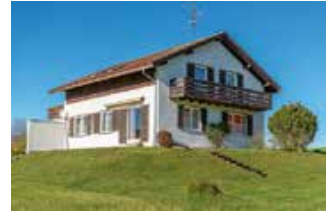
Wohnhaus in Genhofen