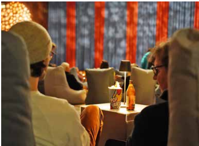
Filmgenuss auf der großen Leinwand – mit Wohnzimmer-Atmosphäre: Das Pop-up-Kino im Großen Saal des Oberstaufener Kurhauses.