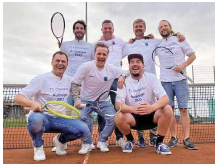
Mannschaft „Herren 30“ in ihren Aufsteigertrikots

Auslosung ist am 8. Juli. Bitte tragt Euch bis dahin auf der Liste am schwarzen Brett, neben dem Eingang zum Clubhaus ein. Es wird in die Kategorie Damen, Herren und Juniorinnen eingeteilt. Die Endspiele sind am 16. Juli um 10.00 Uhr.