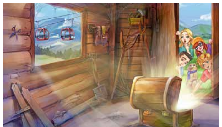
Cover des MounTeens-Detektivwanderbuchs „Der Schatz vom Imberg“

Informationen zum MounTeens-Detektivweg am Imberg: - Benötigte Utensilien: MounTeens-Detektivwanderbuch „Der Schatz vom Imberg“ und Holzmurmeln (an den Kassen der Imberg Talstation sowie in den Oberstaufener Tourist-Infos erhältlich) - Start und Ziel: Bergstation der Imberg Bergbahn - Länge: 3,9 km (mit 146 Hm) - Gehzeit: ca. 2,5 Stunden – je nach Rätsel- und Spielespaß - Ab 6 Jahren - Einkehrmöglichkeiten, Spiel- und Rastplätze entlang des Weges vorhanden Weitere Informationen zu den MounTeens und den Detektivwegen unter oberstaufen.de/mounteens