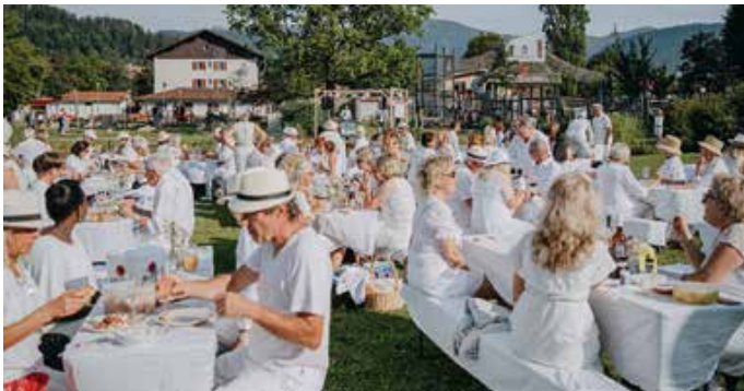
Man hülle sich von Kopf bis Fuß in helle Kleider, packe seinen Picknick-Korb und los!

Das Picknick startet am Sonntag, 6. August, um 18.00 Uhr und endet mit dem Sonnenuntergang. Die musikalische Umrahmung gestaltet die Sängerin Leonie Leuchtenmüller aus Kempten. Der Eintritt zum Picknick in Weiß ist gratis. Mehr Information unter oberstaufen.de/events . Im Falle schlechter Witterung ist der 13. August als Ausweichtermin gesetzt.