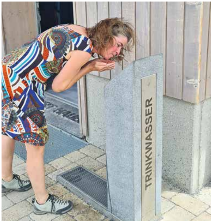
Für stets frisches, klares und sauberes Trinkwasser sorgt Ihr örtliches Wasserwerk

Für stets frisches, klares und sauberes Trinkwasser sorgt Ihr örtliches Wasserwerk.