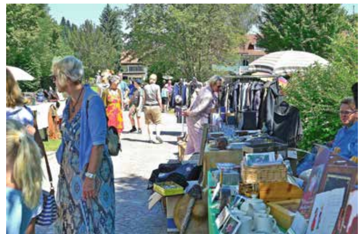
Flohmarkt im kleinen Kurpark