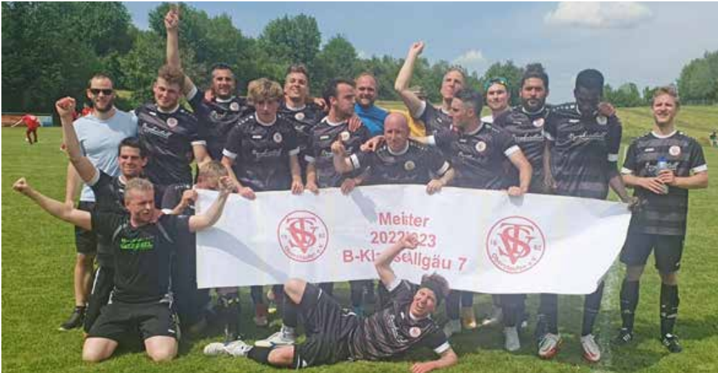
Die zweite Mannschaft des TSV Oberstaufen feiert den Aufstieg in die A-Klasse.