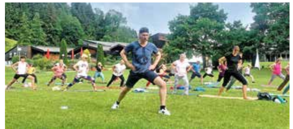
Sonnengruß mit Ralf Bauer im Oberstaufen PARK.