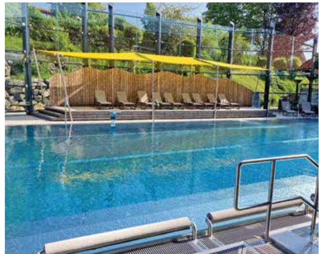
Unser gut beschatteter Außenbereich.