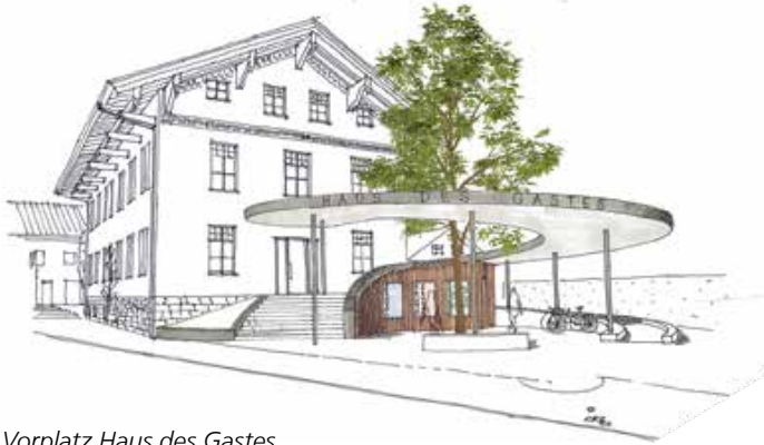
Vorplatz Haus des Gastes