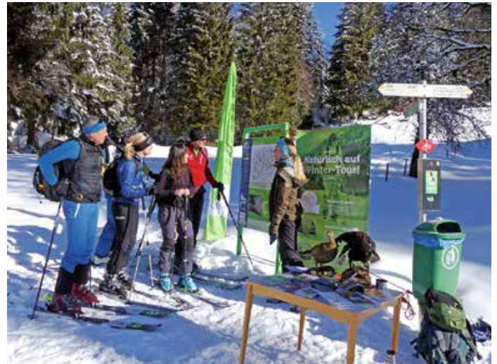
Unsere Rangerin informiert über naturverträgliche Wintertouren im Naturpark