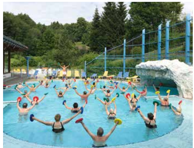
Wassergymnastik im „alten“ Außenbecken