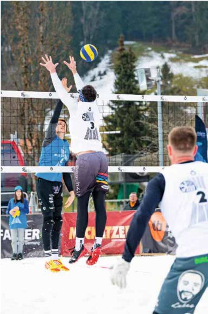
Jeder Punkt hart umkämpft: Die Teams lieferten sich bei der 4. German Snow-Volleyball Championship in Oberstaufen spannende Matches auf Augenhöhe.

Spannende Ballwechsel auf dem Court, tanzende Zuschauer auf den Rängen: Bei der 4. German Snow-Volleyball Championship am 4. und 5. März behauptete