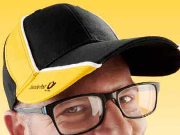
Christian, einer von uns.