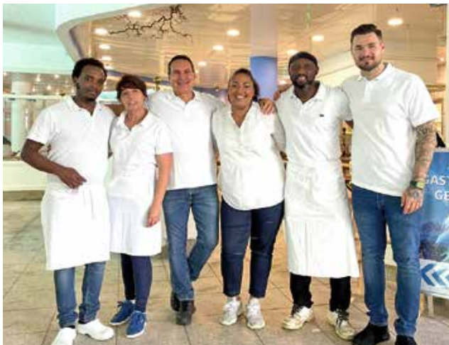
Das neue Team im Restaurant