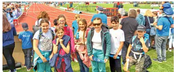
Die Staufner Leichtathleten beim Mehrkampfmeeting in Götzis.

Der Verkauf der Rasenparzellen für den neuen Kunstrasenplatz läuft auf Hochtouren. Dabei hofft der TSV Oberstaufen weiter auf viele „Rasenpaten“, die das Projekt unterstützen. Weitere Informationen zum Kunstrasen-Projekt und zum Kauf der Kunstrasen-Parzellen gibt es unter: www.tsv-oberstaufen.de/kunstrasen