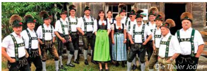
Die Thaler Jodler

10.30 Uhr Frühschoppenkonzert der Thaler Jodler und musikalischem Trio am Hotel Traube in Thalkirchdorf. Nur bei trockener Witterung