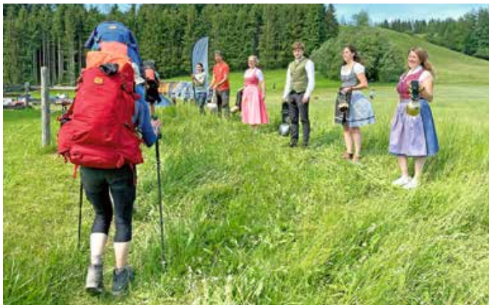
Das OTM-Team bei der Begrüßung der Fjällräven Classic-Teilnehmer im Camp 2, standesgemäß in Tracht und mit Kuhschellengeläut