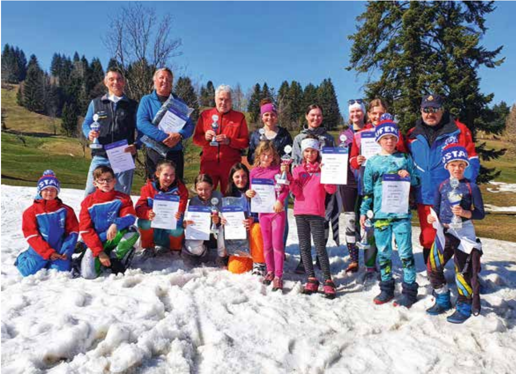
SCO-Team überzeugt mit top Resultaten bei „Westallgäuer Skimeisterschaft“ um den Sport-Hauber-Pokal.