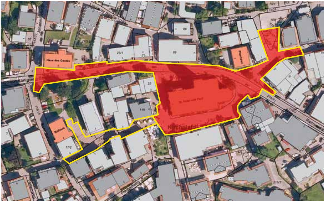
Marktbereich, gelb umrandet: bisheriger Marktbereich, rot: Marktbereich neu