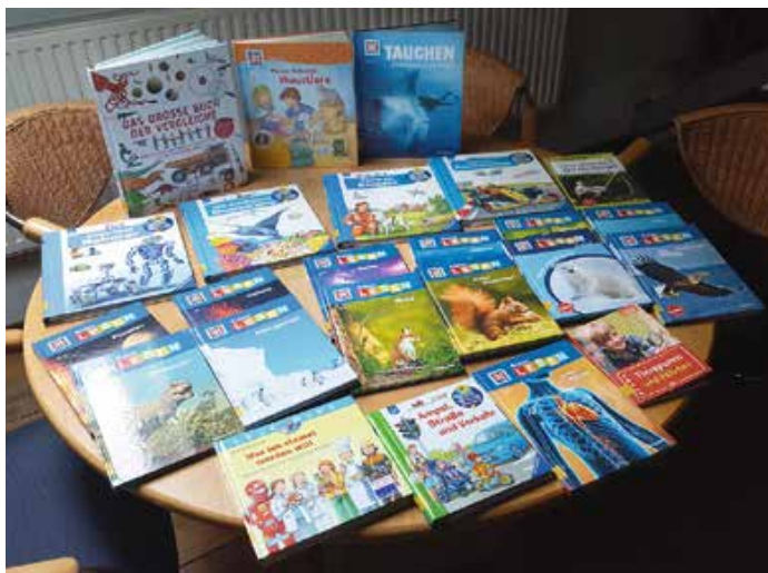
Eine Auswahl der neuen Sachbücher

Wir möchten uns auf diesem Weg ganz herzlich bei der Raiffeisenbank Westallgäu bedanken. Durch eine Spende in Höhe von 250 € konnten wir den Sachbuchbereich mit vielen neuen Büchern erweitern und ergänzen. Unsere Kinder können