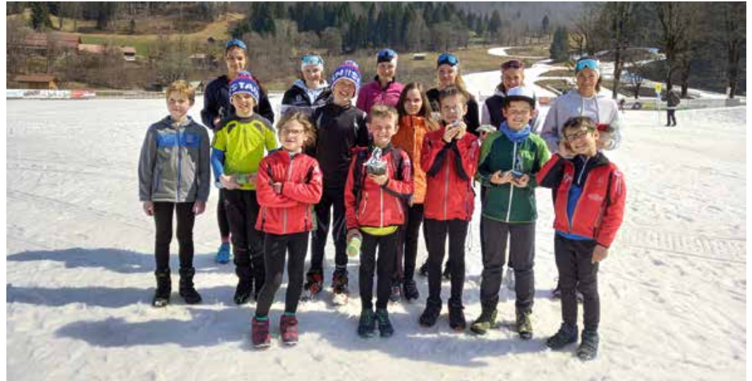
Skilanglaufteam des SC Oberstaufen beendet Rennserie des Allgäuer Skiverbandes (ASV-GEIGER-Langlaufcup 2022) sehr erfolgreich.

Nachdem es beim Abschlussrennen zum „ASV-GEIGER-Langlaufcup 2022“ in Oberstdorf wegen technischer Pannen kein Endergebnis zur Pokalgesamtwertung gab, hat der SC Oberstdorf dieses Malheur als Veranstalter mit einer tollen Abschlussveranstaltung wieder wett gemacht und am Samstagvormittag (26. März) zur Gesamtsiegerehrung mit Rahmenprogramm ins „Nordic-Zentrum“ geladen. Aufgrund der teilweisen fehlerhaften Laufzeitergebnisse beim sogenannten Finalrennen konnten sie durch Recherchen, Aufzeichnungen und auch durch Videobeweise den Wettkampf rekonstruieren und die Ergebnisse so richtigstellen. Als quasi „Wiedergutmachung“ hatten sich die Oberstdorfer-Ausrichter für das nochmalige Anreisen ein zusätzliches Rahmenprogramm ausgedacht, bei dem die Sportler/innen ihr Können in einem Technik-Parcours ohne Zeitmessung (mit Bergauf- und Bergabslaloms, Tretorgel, Stangenwald und Achterlaufen) einmal zeigen konnten und danach ihre Schieß- und Trefferfähigkeit auf einer Biathlon-Laserschießanlage mit 3 Bahnen testen durften. Im Anschluss fand dann die Gesamtsiegerehrung im gebührenden Rahmen statt. Hier landeten die Langläufer/innen des SC Oberstaufen insgesamt achtmal auf dem Podest und stellten dabei fünfmal die Klassensieger. Aus der Nachwuchsgruppe des Trainergespans von Tessa Music