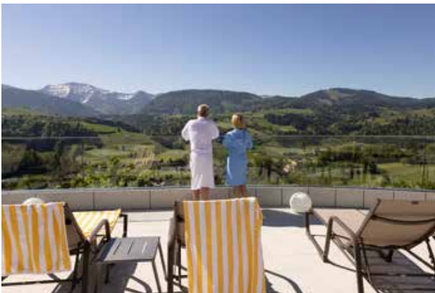
Voller Zuversicht blicken wir ins Neue Jahr.