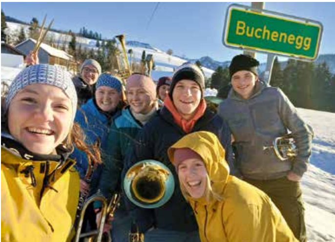
Alle getestet oder geimpft.